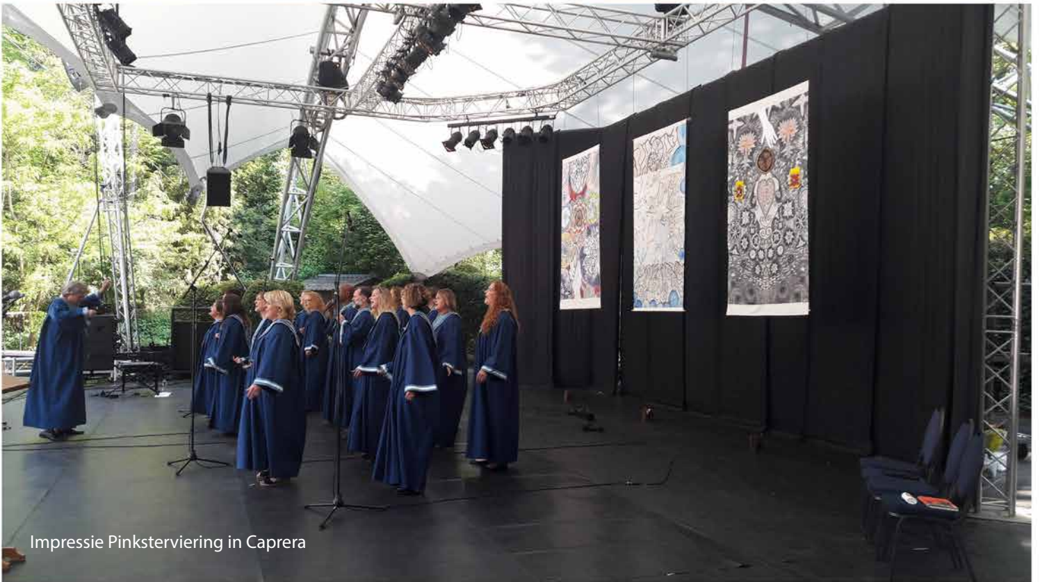
Impressie Pinksterviering in Capra