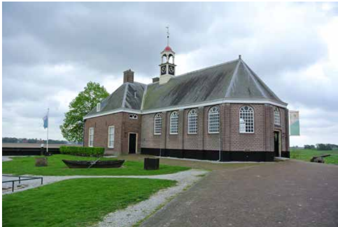
De Enserkerk uit 1834. Rechts het kanon om de vijand te weren, links een boot om aan eventueel hoog water te ontsnappen