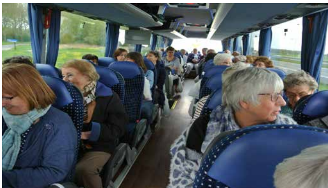
De reizigers op de terugweg.