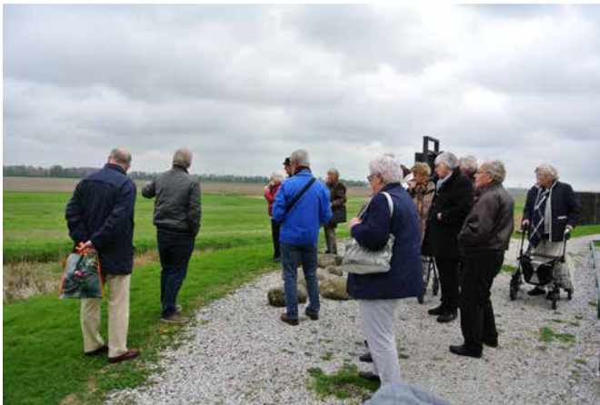
Een deel van de groep luistert naar de gids op Schokland