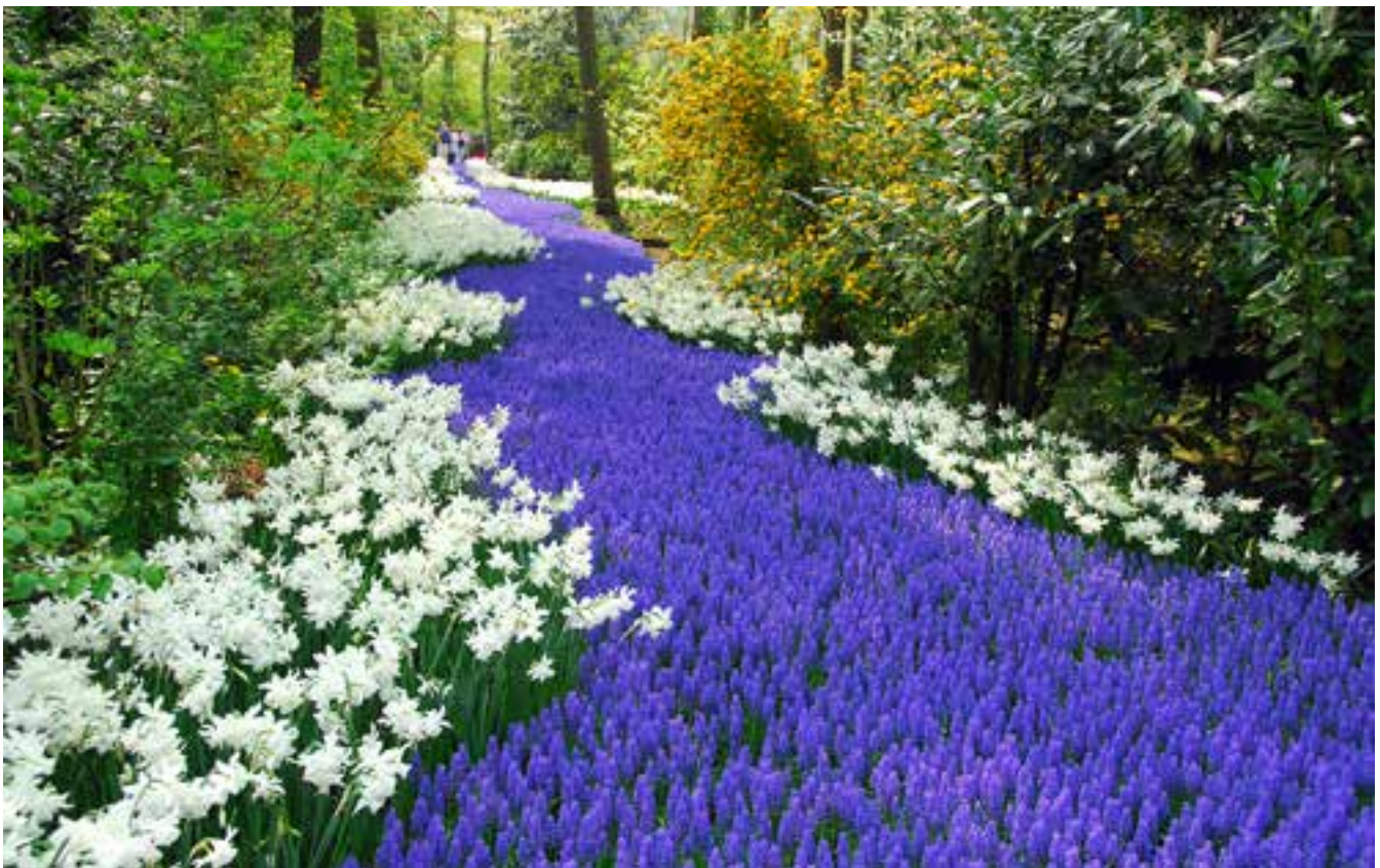
Met Pasen gaan we van het paars van de Veertigdagentijd naar het wit van Pasen.