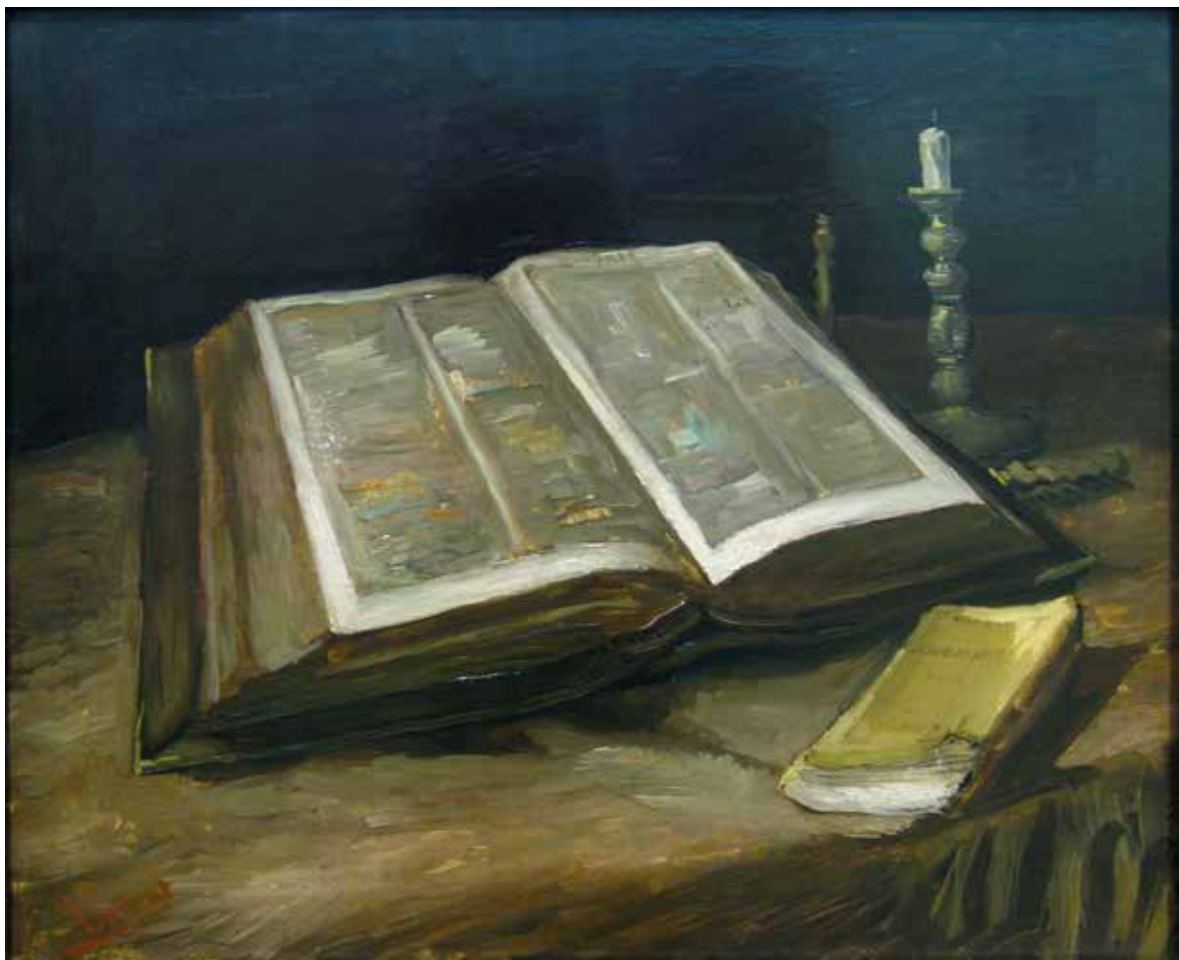
Stilleven met bijbel, 1885, Vincent van Gogh (1853-1890), Olieverf op doek, 65.7 x 78.5 cm Van Gogh Museum, Amsterdam.